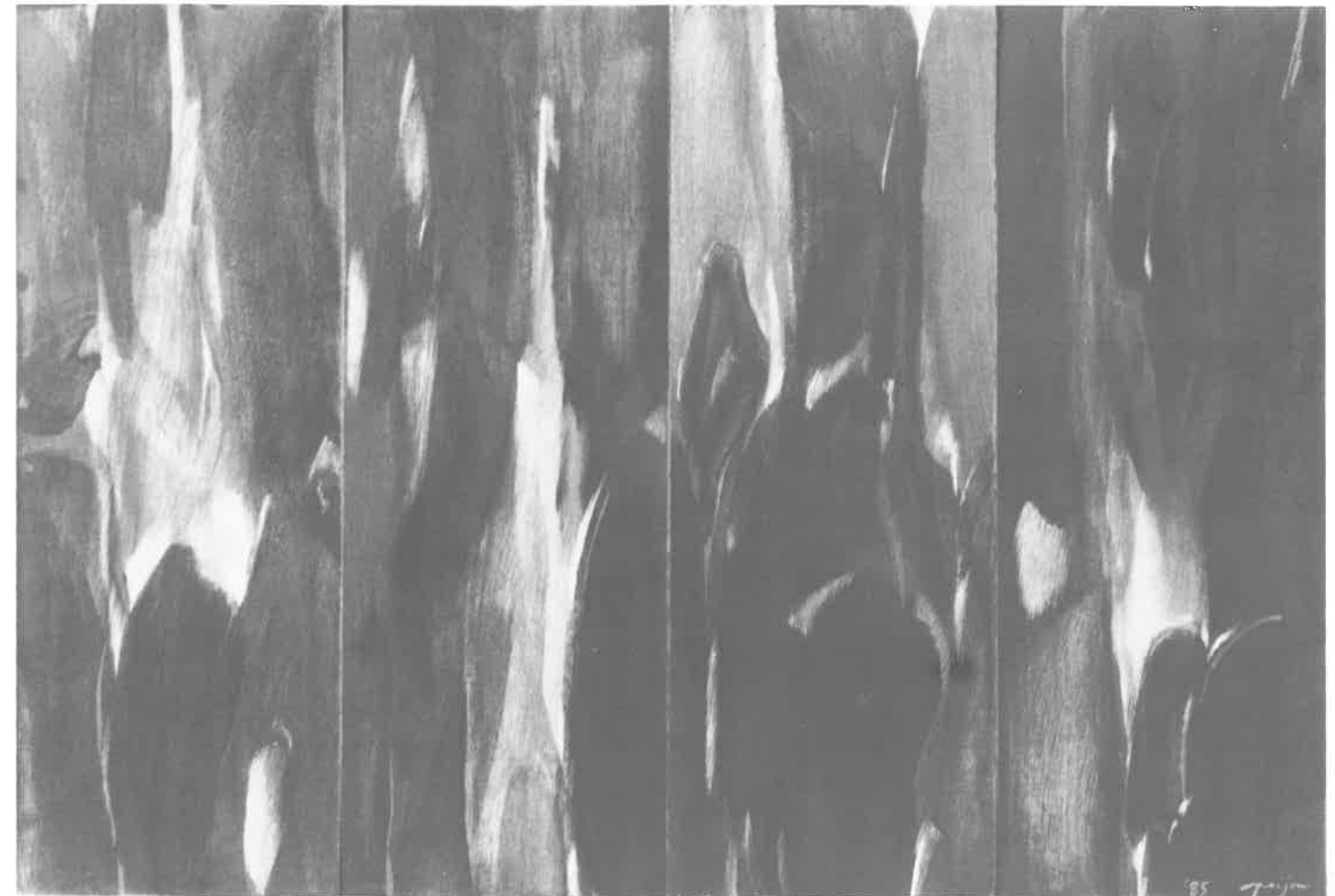
「UTAKI-Sumazu-6 33.3×48.6cm 1985年