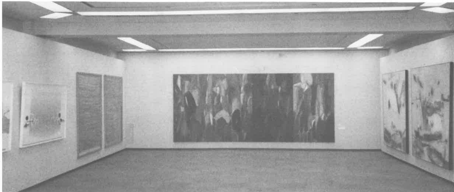
「UTAKI-Sumazu-3 194.0×448.8cm 1985年 (セントラル'86展)